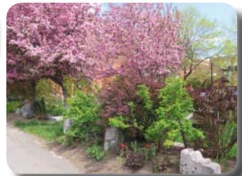
Arrangement floral au début de l'été

Qu'est-ce qui a été fait jusqu'à présent ? Nous avons ramassé beaucoup de pots de terre destinés aux rebuts dans lesquels