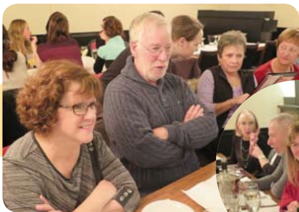
Les membres de l'Outaouais ont apprécié le repas de Noël