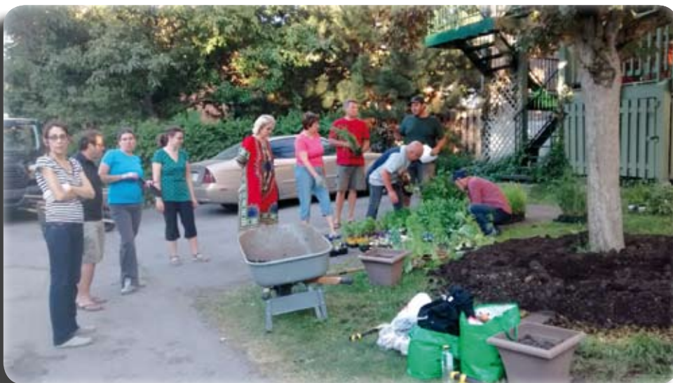
Les voisins se mobilisent pour embellir la ruelle