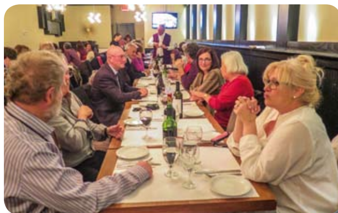
Souper de Noël des membres de l'APRFAE - Outaouais

Francine Tremblay pour le comité régional de l'APRFAE-OUTAOUAIS