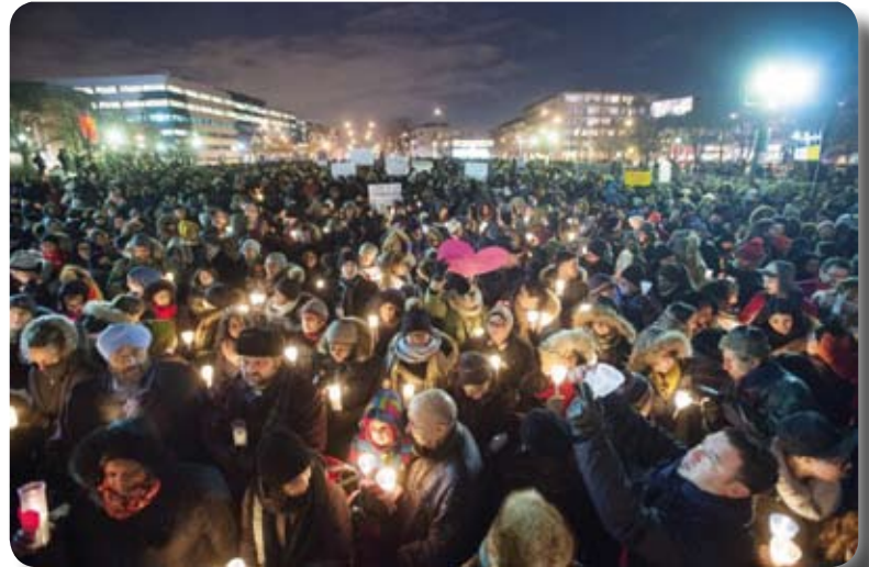
Nous étions là de tout coeur avec tout le monde

Cette vigile, organisée par de simples citoyens engagés, appelle aussi par son nom même à être vigilants contre toute forme de violence d'où qu'elle vienne et peu importe envers qui elle s'exerce!