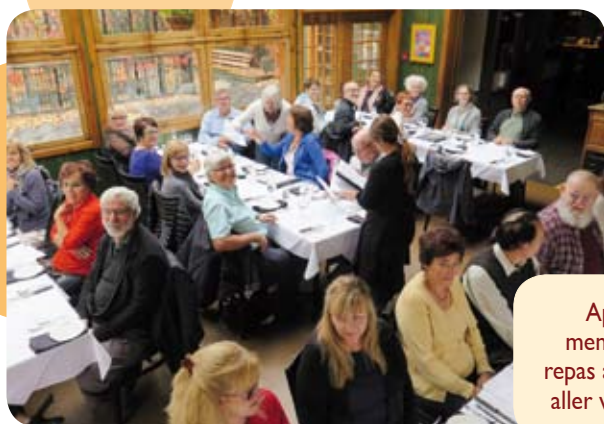
Après une visite du Vieux Sainte-Rose, les membres se sont rassemblés autour d'un bon repas au restaurant Les Menus-Plaisirs pour ensuite aller visiter l'exposition des artistes de l'APRFAE