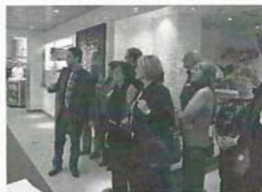
On a même visité les cuisines.

Les commentaires sont unanimes : « C'était très agréable ».