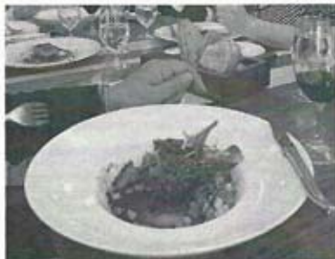
Au menu, épaule de bœuf braisée avec sauce bordelaise, délicieux!

Les membres qui sont venus en groupe ont beaucoup ri dans les autobus. Pour ceux et celles qui sont venus à l'activité de Montréal en métro, ils auront le plaisir de venir à leur tour en groupe dans la région de Gatineau au mois de mai.