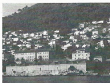
Dubrovnik, ville portuaire.

Kotor, nichée au creux de la baie de Kotor, magnifique Fjord de l'Europe du Sud, ce joyau du Monténégro plaît autant pour l'aspect pittoresque de sa vieille