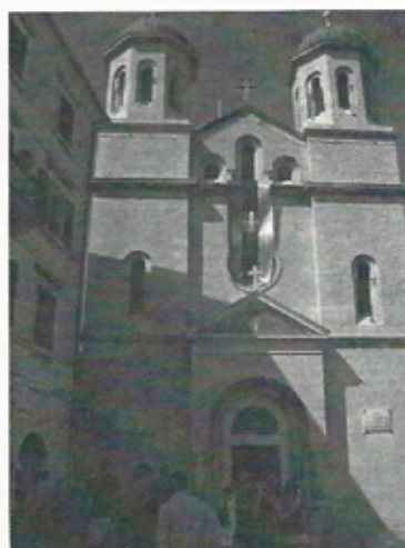
Église orthodoxe, de Saint Nicolas à Kotor (style pseudo bysantin).

Ces deux pays faisaient partie de l'ex-Yougoslavie et ont connu la guerre dans les années 1990. La Croatie qui a été attaquée violemment par la Serbie, particulièrement Dubrovnik, s'est reconstruite rapidement grâce à l'aide de l'UNESCO et à la fierté de son peuple.