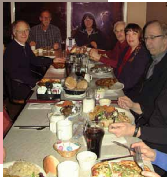
On a l'assurance d'être en bonne compagnie avec nos membres et futurs membres de l'APRFAE Haute-Yamaska !