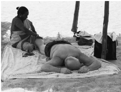
Prendre un massage sur la plage, à Goa.

Aux dernières nouvelles, le passeport électronique est prévu pour le 1er juillet 2013. Voici le lien approprié : http://www.ppt.gc.ca/eppt/about.aspx?lang=fra