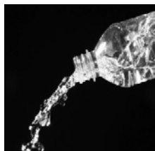
En route ensemble vers un virage vert

embouteillées proviennent des services publics d'eau, donc d'un aqueduc et non de sources naturelles ? Saviez-vous aussi que leur transport de même que leur entreposage prolongé, souvent dans de mauvaises conditions, en altèrent la qualité et les rendent même non sécuritaires ? Selon l'organisme Eau Secours !, au Québec, l'eau du robinet est d'excellente qualité partout.