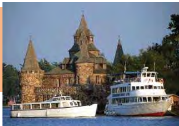
Une journée de rêve nous attend aux Mille-Îles !