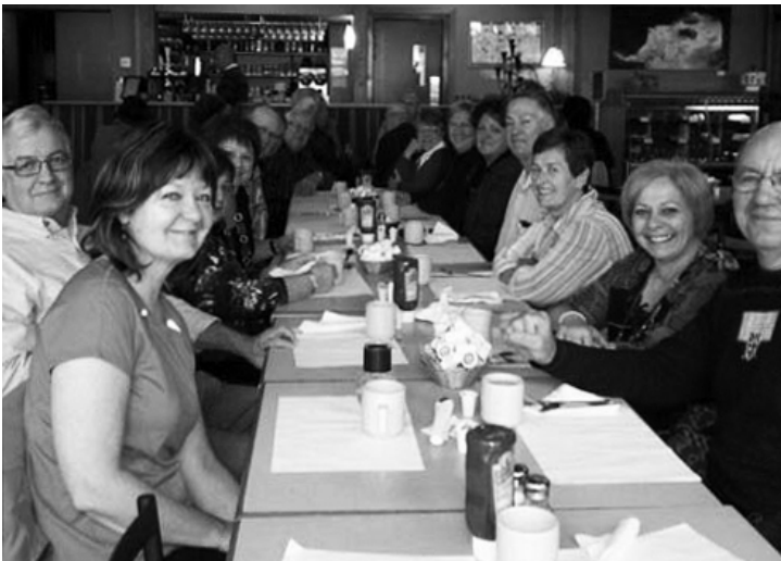
Les membres de l'Outaouais se rencontrent pour le petit-déjeuner au restaurant St-Éloi, sur la rive du magnifique lac Leamy.

La région de l'Outaouais continue sa lancée de recrutement. Hé oui, nous approchons déjà la centaine de