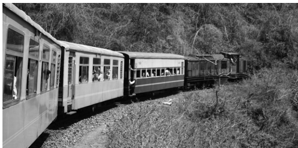
Le «Toy Train» grimant l'Himalaya

2 à 3 semaines. Beaucoup de déplacements en bus, train ou auto. Beaucoup de marche, \pm 6 heures/jour. Hôtels différents. Convient bien aux gens désirant connaître un pays pour un intérêt particulier. Ex. : l'histoire de ce