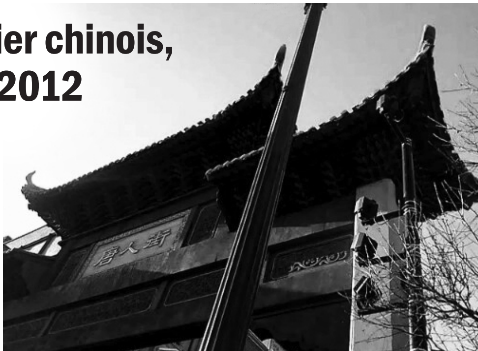
Une des quatre portes du quartier chinois

La communauté chinoise désirait une banque, mais elle n'a pas réussi à l'obtenir des francophones des Caisses Desjardins. La banque HSBC, dont le siège social se trouve à Londres, a répondu