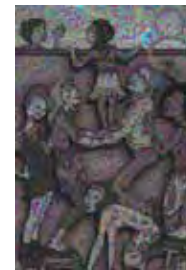
Le Collectif 8 mars, Huguette Latulippe/ Promotions inc. Illustration : Geneviève Guénette

Nous vous invitons donc le 28 mars au bureau de l'APRFAE en après-midi. Vous recevrez l'invitation par courriel ou courrier postal.