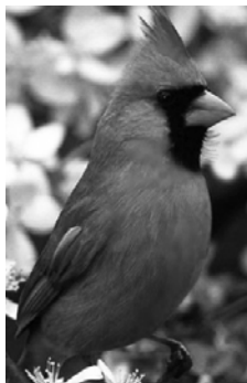
Verrons-nous le cardinal majestueux ?

En après-midi, grâce à des guides qualifiés, nous nous transporterons dans les pays d'origine des plantes qui se développent dans des serres du