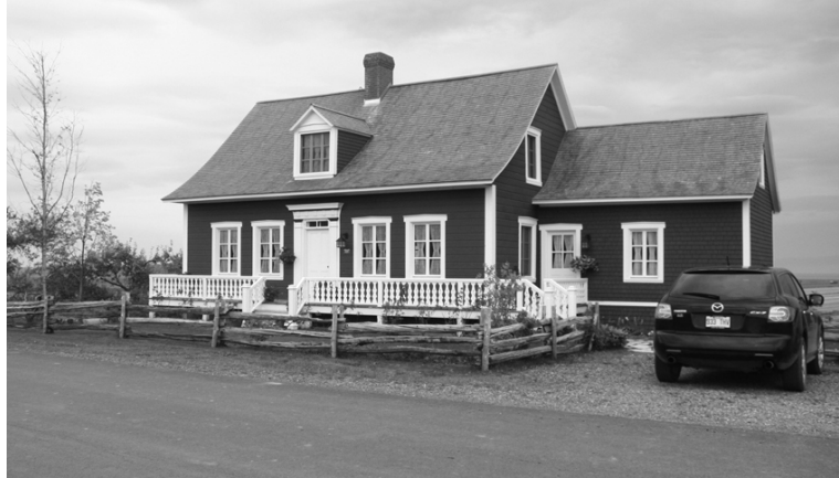
Voici un exemple de maison qui pourrait très bien faire l'objet d'un échange : la casa de Magda à Kamouraska.

Certains sites sont indépendants et d'autres vous demandent des frais