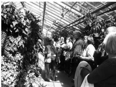
La guide bénévole dans la serre des bégonias

Je ne sais pas si c'est le pollen qui s'est attaché à nos vêtements mais, lors de notre entrée dans la volière, nous sommes poursuivis par des