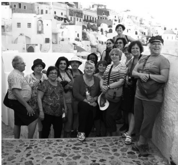
Les voyageurs à Santorin dans un décor subliminal

Le 10 mai. Athènes. La voici : l'ACROPOLE ! Même de l'hôtel, nous l'avons juste en face de nous. Très bon