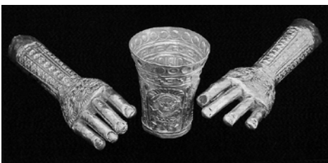
Parures royales en or pour les défunts

La cérémonie du sacrifice chez les Mochicas (I – VIIIe s. ap. J.-C.),