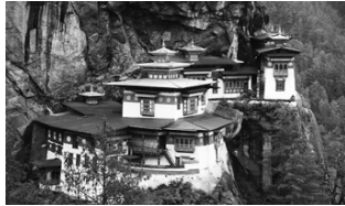
Site privilégié au Bhoutan

la population est plus éduquée et en meilleure santé, les Bhoutanais atteignent l'autosuffisance et sont maintenant plus grands de taille. De plus, leur espérance de vie a augmenté sensiblement, soit de 20 ans depuis 1980.