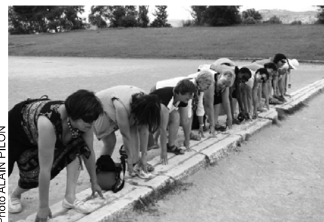
Les filles sur la ligne de départ à Olympie

15 mai. Nous sommes aux Météores. WOW ! Superbe ! Des formations rocheuses austères sortent d'une immense vallée plantée d'oliviers; des monastères très haut juchés surplombent ce paysage verdoyant.