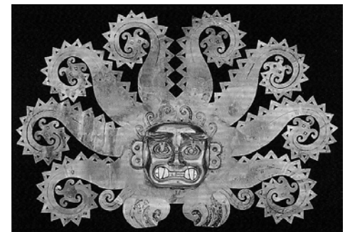
Mona Lisa péruvienne

La pièce de clôture de l'exposition s'appelait « Mona Lisa péruvienne » : un poulpe en or de l'époque mochica (IVe – Ve s. ap. J.-C.), une terrifiante divinité marine