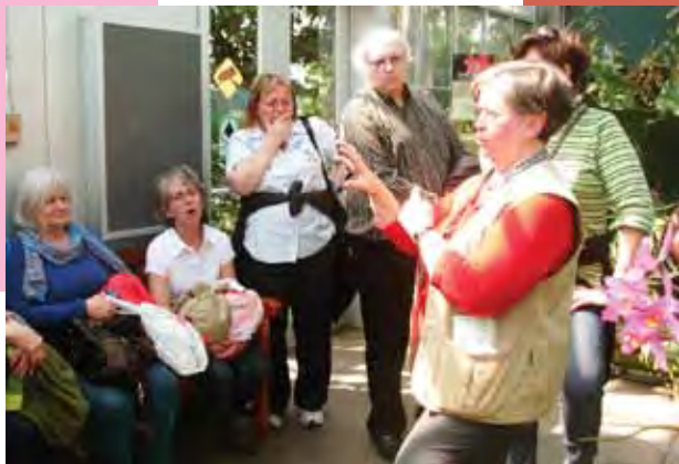
Une guide bénévole nous explique les plantes dans les serres.