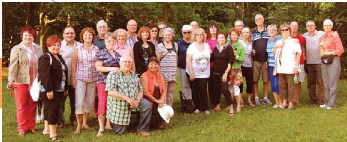
Les membres de l'APRFAE Outaouais