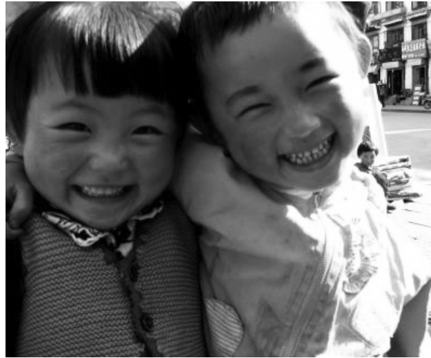
Enfants jumeaux chinois, même traitement ?

Les familles ont également été punies à leur naissance en n'ayant pas droit à certaines indemnités.