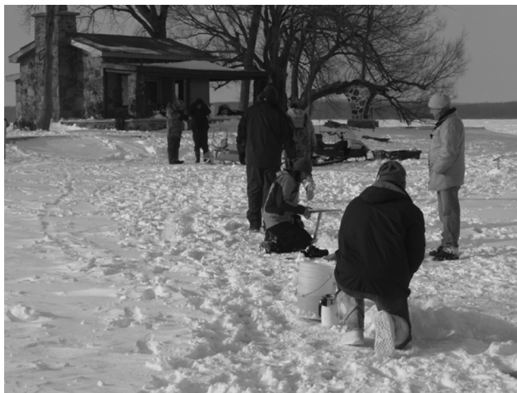
Chalet de pierres et pêche

LISE GERVAIS pour le comité des activités