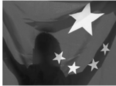
Ombre en arrière du drapeau chinois

Les conséquences encourues sont multiples : l'enfant ne peut aller à l'école, il n'a pas droit aux soins médicaux. Il ne peut ni voyager ni se marier. Ces enfants, sans-papier, sont mis au ban de la société.