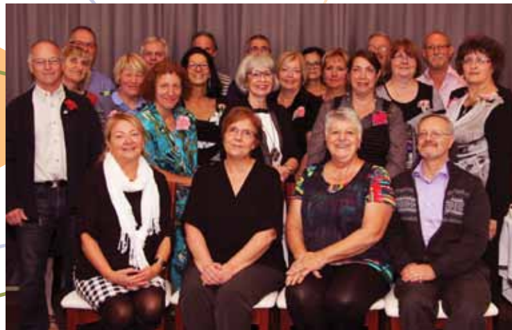
Belle réception pour les retraités 2013 de la Haute-Yamaska. Un bon cru ! Jugez-en par vous-mêmes !