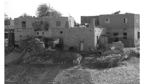
Paysage saisi d'une croisière fluviale

fleuve, plus le séjour peut être long, donc moins de pliage de bagage en vue (hi hi hi !). Ainsi la Volga et la Neva (Russie) vont attirer une clientèle qui passerait 11, 12 ou 13 jours, de Moscou à Saint-Petersbourg. Les plus courtes ne sont pas à dédaigner : la Seine vous amènera sur le chemin des impressionnistes, en 4, 5 ou 6 jours; « Couleurs provençales » sur le Rhône vous garde au parfum 6 jours; « Le Guadalquivir et le Guadiana » en Espagne (passage par le Portugal, si l'on veut) vous offre 4, 5 et jusqu'à 8 jours; le Rhin, avec sa croisière transeuropéenne, 13 jours, vous promène à travers 3 pays; et que dire du Danube avec ses « Perles » qui vous fait connaître 3 pays en 7 jours ? Ou « Budapest et le beau Danube bleu », 11 jours et 4 pays ? Finalement, « Traversez l'Europe » en 13 jours vous fait visiter 5 pays. Pour plus d'info : mrbscaron@hotmail.com