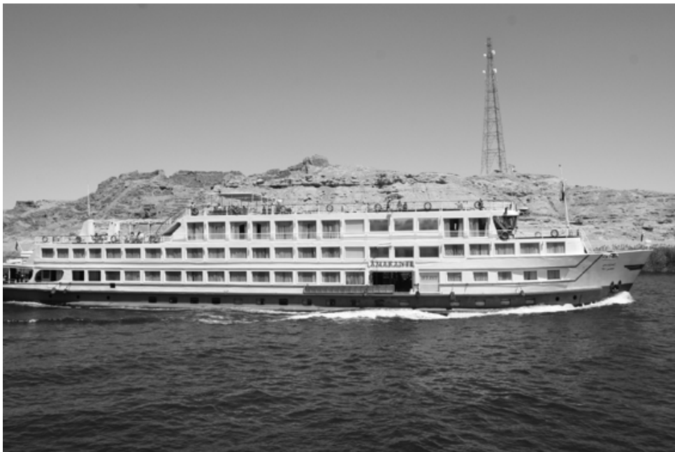
Exemple de bateau de croisière fluviale