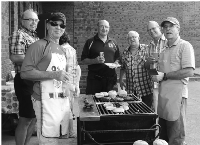
Des membres encouragent les cuisiniers.

Le 19 avril dernier, une quinzaine de membres ont participé à une initiation au mini-tennis. Celle-ci a porté fruit, car une dizaine de membres sont venus se