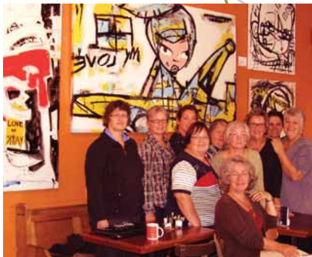
De jolis minois de l'APRFAE Haute-Yamaska au restaurant Le Cafetier de Sutton, ayant comme toile de fond les couleurs de l'artiste bromontoise ZUT