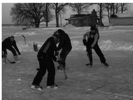
On joue au hockey jusqu'à ce que la ligne morde de l'autre côté du chalet.