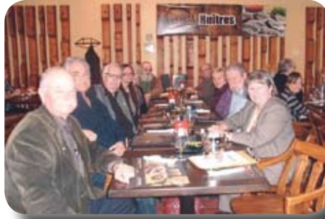
Dîner chez Magnan