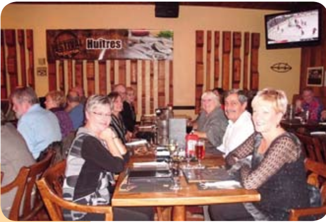
Une autre tablée de nos membres chez Magnan à Montréal en novembre dernier.