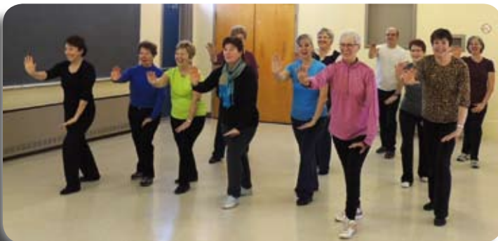
Cours de Tai-Chi