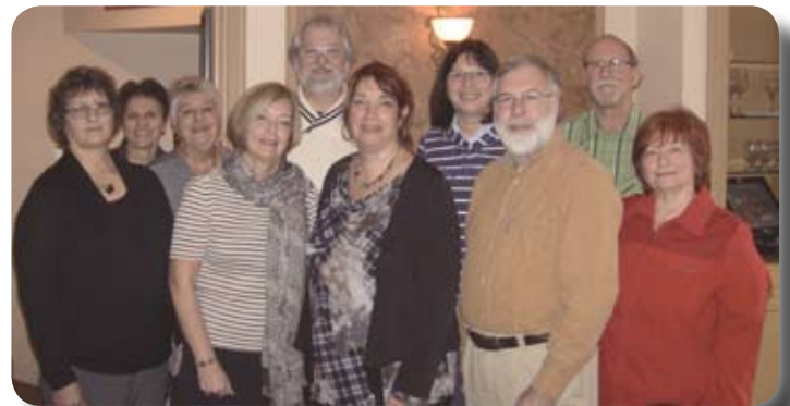
Les nouveaux membres de la Haute-Yamaska sont accueillis par les anciens au restaurant Di Carlo de Granby.