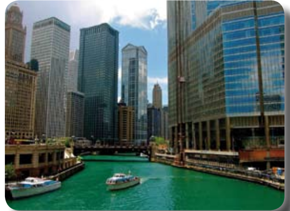
Ville de Chicago

Lise Gervais pour le comité des activités