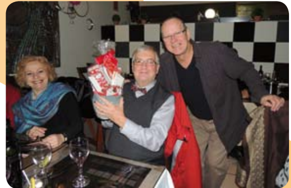
On fête en Outaouais.