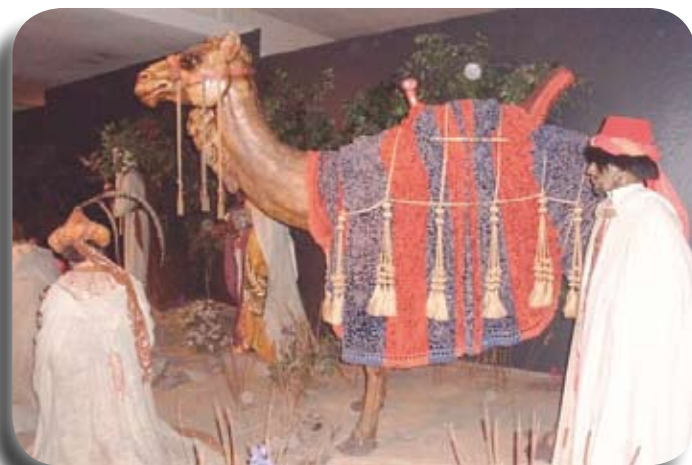
Collection de crèches de Noël au Musée de l'Oratoire

Pour toute autre information, veuillez communiquer avec la responsable de l'organisation de l'activité, Thérèse Hamel, au 450-965-0785.