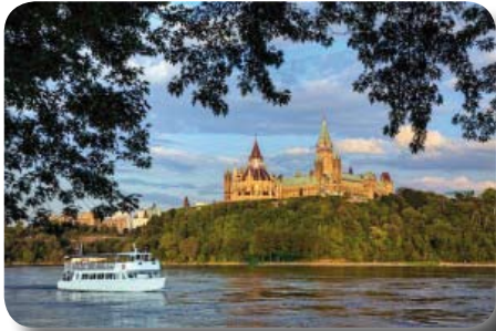
Croisière en Outaouais

Pour le jeudi 5 juin, nous organisons une croisière sur la rivière des Outaouais, d'une durée de trois heures (15 h à 18 h). Il nous reste à voir si nous dînons ou nous soupons sur la terrasse du Rest'O'Bord. Le menu est varié et pas coûteux (table d'hôte disponible). Il y a de la musique d'ambiance sur la terrasse ainsi qu'une