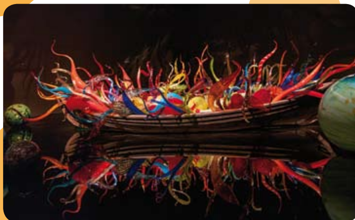
(oeuvre de Chihuly, exposition MBAM, 2013)