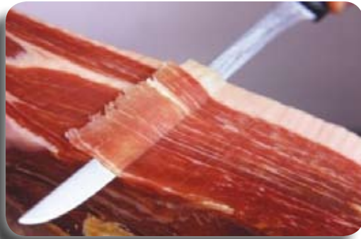
Jamón ibérico (jambon ibérique)

Au Portugal, nous commencerions par Lisbonne, Obidos, Caldas da Rainha, Aveiro, Porto, Coimbra, Évora et nous arrêterions à Albufeira, à Algarve, la plus belle région touristique portugaise, avec ses côtes découpées de belles falaises. Nous traverserions du Portugal en Espagne en autocar, en passant par Séville (je l'ai demandé). Nous continuerions notre repos, à la Costa del Sol, à Torremolinos plus précisément, puis nous remonterions