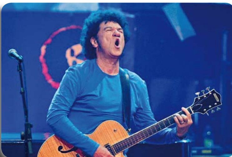
Musée McCord - Robert Charlebois

En parcourant la zone Vivre sa fantaisie , je plonge dans une tout autre ambiance. Je découvre la lutte contre le conformisme et les tabous menée par des artistes au moyen de costumes de scène et d'accessoires. Les célèbres lunettes ayant appartenu à André « Dédé » Fortin, de même que la robe-théâtre de Diane Dufresne et la robe portée par Céline Dion dans le cadre des célébrations du 400 e anniversaire de Québec