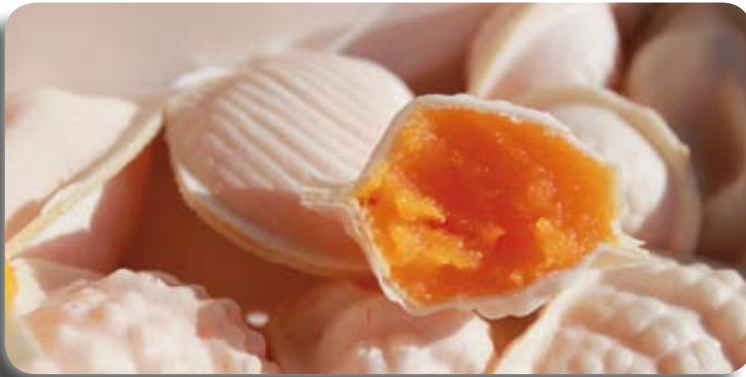
Ovos moles : dessert à base de jaune d'œuf

Bien sûr nous n'en sommes qu'aux préliminaires mais sachez que déjà notre voyageur nous a arrangé quelque chose de bien pour trois semaines, au printemps alors que la nature se réveille. Ce serait en principe le 12 avril. Nous avons fait le choix de ce temps, après Pâques et avant le mois de mai, car les coûts sont plus abordables et il ne fait pas trop chaud encore pour les visites.