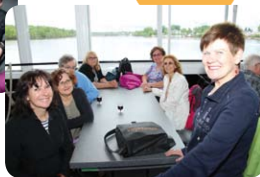
... à la croisière