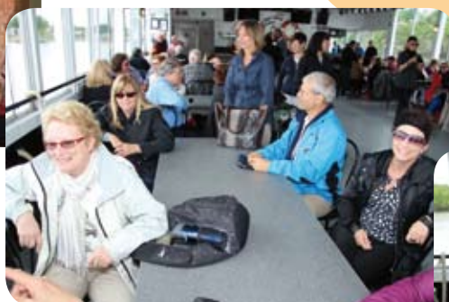
Tablée de membres...