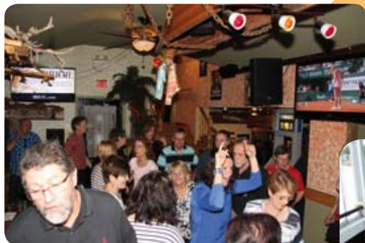
Lors de la sortie en Outaouais, la piste de danse au Rest'O'Bord était toujours très populaire.