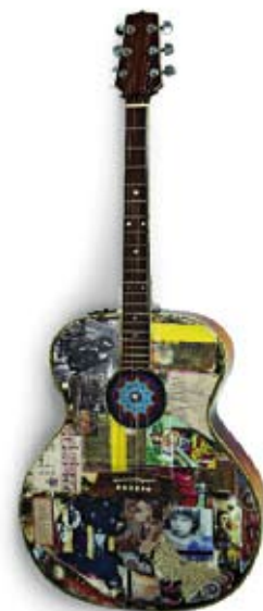
Musée McCord - Guitare de Richard Séguin

qui expriment une part de leur monde fantasmagorique.