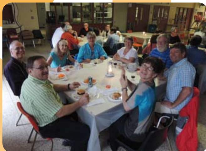
Le BBQ en Outaouais fut très populaire