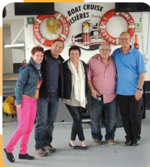
Comité organisateur de l'Outaouais