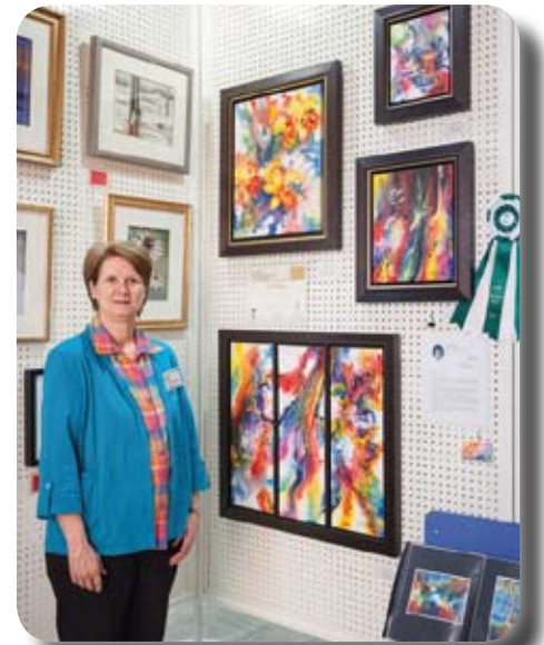
En 2013, deuxième prix pour les aquarelles sur toile « Coup de cœur du jury », à Sainte-Anne-des-Plaines

Je suis une assoiffée de connaissances. La musique et les arts visuels m'aident à relaxer, m'évader et développer mon talent. En aquarelle, ma palette regorge de couleurs