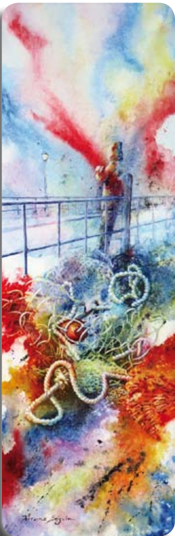
En 2014, à l'Exposition annuelle de Joie de l'aquarelle, j'EFFACERAI LE TEMPS (aquarelle sur toile) a obtenu un prix