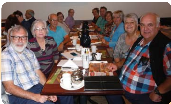
Déjeuner-rencontre de septembre en Haute-Yamaska