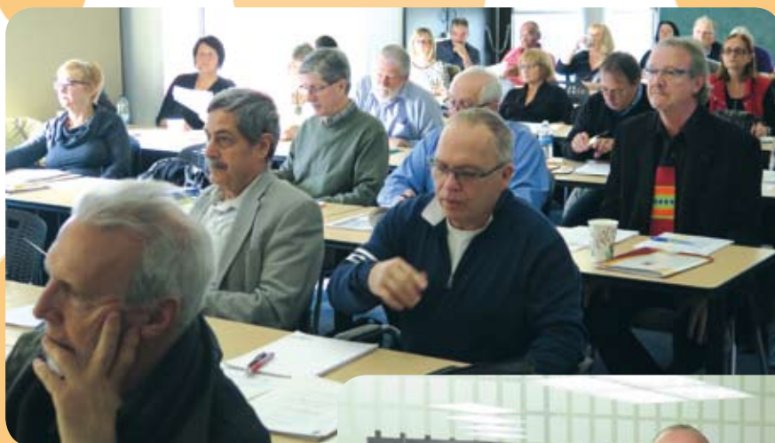
L'attention des membres est soutenue à l'assemblée générale annuelle