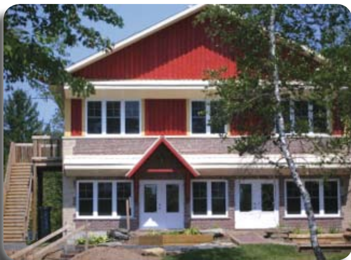
L'EXorde - www.lexorde.com