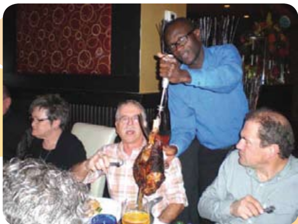
Souper de Noël dans l'Outaouais