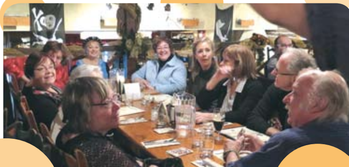
Au Cabaret du Roy, nous écoutons attentivement la serveuse qui crie le menu en ancien français