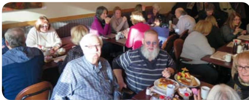
Déjeuner au Coco Gallo