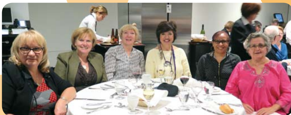
Dîner à l'ITHQ