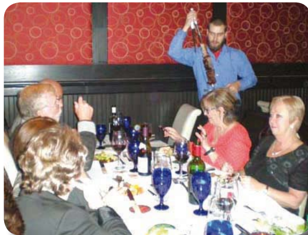
Souper de Noël de la région de l'Outaouais