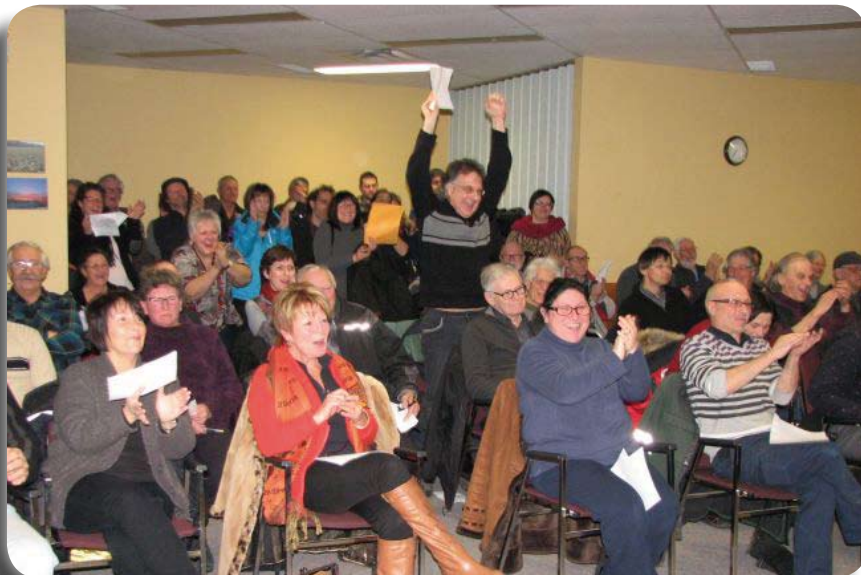
La MRC D'Autray s'oppose, manifestation citoyenne de joie 4 février 2015