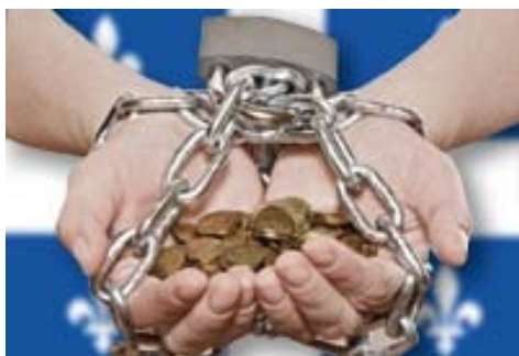
Image tirée de classiques.uqac.ca pour « La méthode de l'OCDE : une juste mesure de l'endettement du Québec ? » de Louis Gill

Afin de faciliter notre compréhension, l'Institut de recherche et d'informations socio-économiques (IRIS) a publié la brochure État de la dette du Québec 2014 . Dans cette publication, les chercheurs confirment la thèse voulant que le gouvernement utilise la dette pour nous divertir de son objectif réel soit le financement privé des services publics.