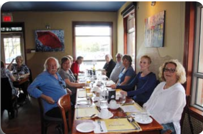
La bonne humeur est au rendez-vous en cette belle journée!