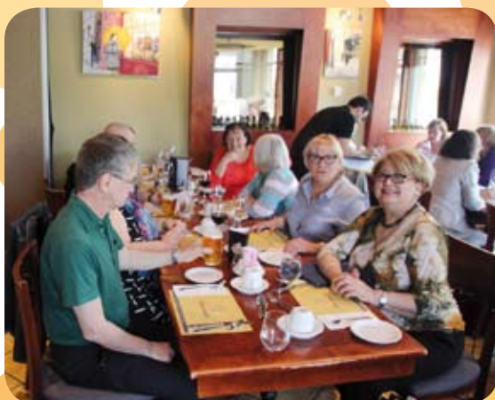
Des anciens et nouveaux membres font connaissance autour d'un bon repas