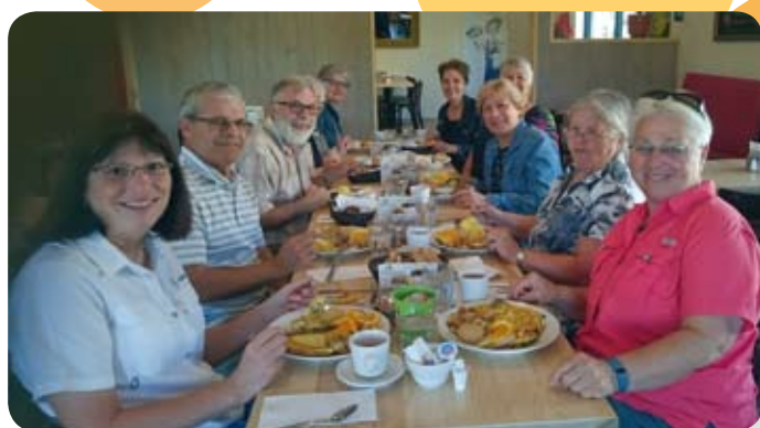
Le groupe estival de l'APRFAE Haute-Yamaska Chez Dame Tartine à Bromont

Miam! Délicieux! Super restaurant! Belle surprise!