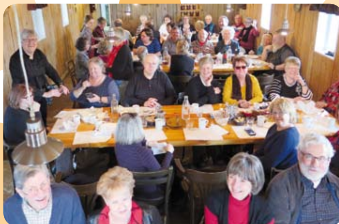
Bien repus après le repas à la cabane, on est tout sourire