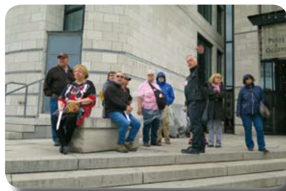
Au rallye une équipe écoute attentivement le guide

Au souper, nous étions 48 personnes à discuter chaleureusement de notre activité et à comparer nos réponses du rallye, à la microbrasserie-restaurant-bar Les 3 Brasseurs , du Vieux-Montréal. Des gens de l'Outaouais, de la Haute-Yamaska, de Vaudreuil et de partout ont contribué à créer cette belle atmosphère avec leur bonne humeur qui s'entendait. Plusieurs nouvelles personnes retraitées ont participé à cette sortie de fin d'année. Ça jasait, mes amis!