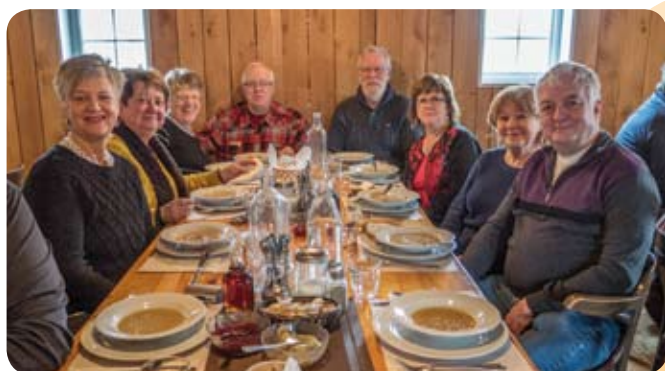
Les membres de l'Outaouais aussi ont apprécié le repas à la cabane à sucre