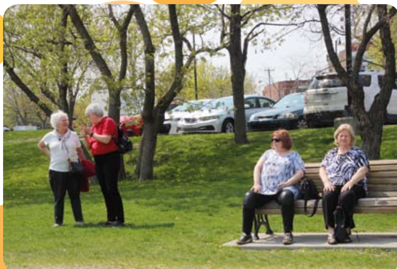
Un bel après-midi au Crescendo face au fleuve St-Laurent