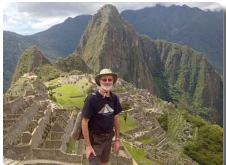
"Je suis à mon 3 e voyage depuis ma retraite"