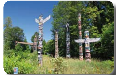
Totem dans le Stanley Park à Vancouver

L'Alaska nous a frappés par tous ses rivages ourlés, ses arbres qui vivent dans la brume, ses cascades nombreuses tout le