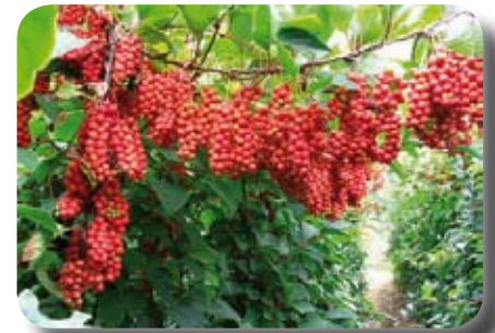
La schisandra procure de l'énergie

Pour ceux et celles qui sont inquiétés par des tumeurs ou des