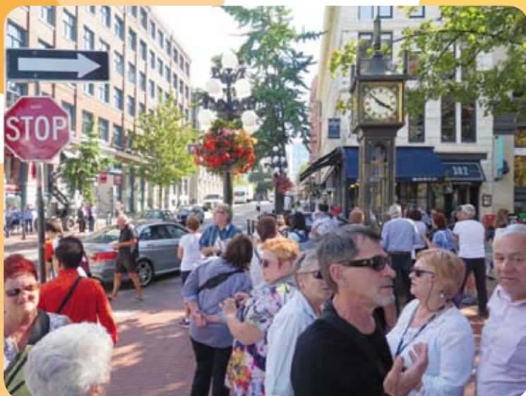
Une partie du groupe au Gastown à Vancouver