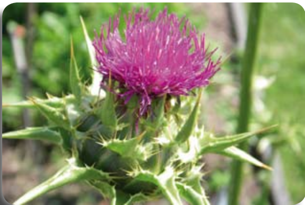
Le Chardon-Marie allège le foie

Herboristerie L'Alchimiste en herbe , 4567 rue Saint-Denis à Montréal