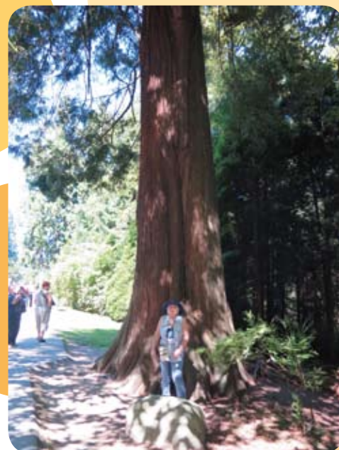
Thérèse Hamel sous un thuya géant