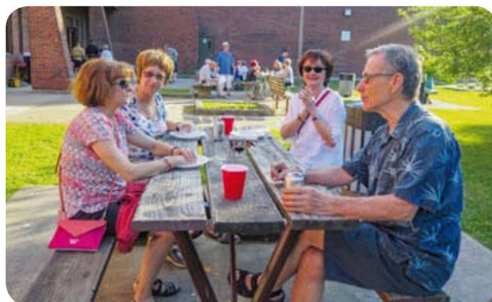
L'année 2015-2016 s'est clôturée avec notre BBQ annuel