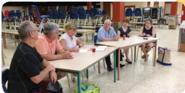
Les membres du conseil d'administration de la région de l'Outaouais lors de leur assemblée générale