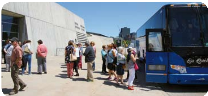
Visite au Musée canadien de la guerre à Ottawa suivi d'un repas au Rest'O'Bord Le Pirate