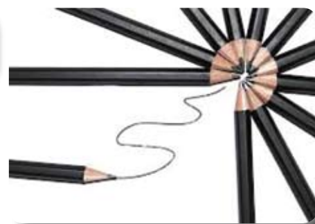
Crayons B, H, HB...

Le fusain s'achète en bâton ou en crayon, à l'unité ou en boîte, noir ou de couleur. Le fusain en bâton n'est que du charbon de bois, et on y ajoute de l'argile pour faire un crayon. On s'en sert pour les esquisses, les croquis,