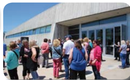
Devant le Musée canadien de la guerre

Hall, résidence du Gouverneur général. Le temps étant des plus cléments, nos visiteurs en ont profité pour se délier