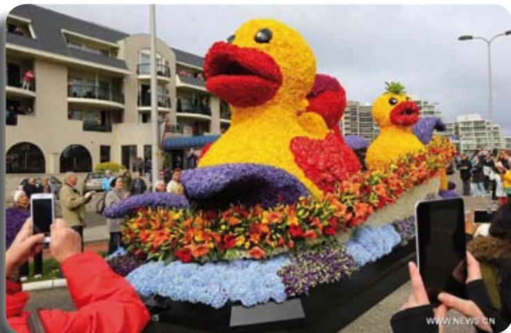
Le Corso fleuri, 20 chars allégoriques sur 150 km, aux Pays-Bas

Chaque année, le comité des activités se penche sur un voyage continental ou intercontinental, en alternance. Au comité des activités, nous étudions alors 3 voyages d'agences qui offrent la destination. Nous soumettons au Conseil d'administration les