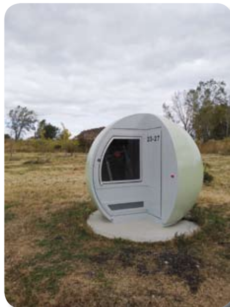
Puits de captation

métamorphose complète : des sentiers bien aménagés, plusieurs aires de pique-nique et des œuvres d'art publiques, des belvédères, dont un à 360 degrés offrant une perspective sur le centre-ville, le Mont-Royal et le Stade olympique. Quelle vue magnifique!