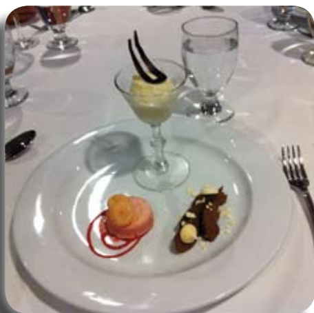
Un avant-goût : quelques mignardises en dessert

Comme il n'y a que 3 activités nationales par année à l'APRFAE : l'activité de la rentrée en octobre, la cabane à sucre et la sortie de fin d'année, l'activité de Noël devient alors une activité locale. C'est ainsi qu'au comité des activités nous avons décidé d'aller à l'ITHQ, qu'on appelle si joliment le restaurant de La Relève gourmande , le jeudi 7 décembre 2017. Les places étant limitées à 45 personnes, si la demande est trop forte, nous réserverons aussi des places pour le vendredi 8 décembre. Une lettre détaillée suivra en temps et lieu. Réservez la date à votre agenda.