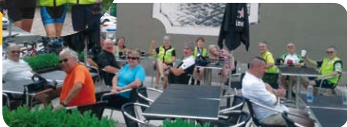
Pause bien méritée suite à la randonnée en vélo des membres de l'APRFAE de la région de l'Outaouais