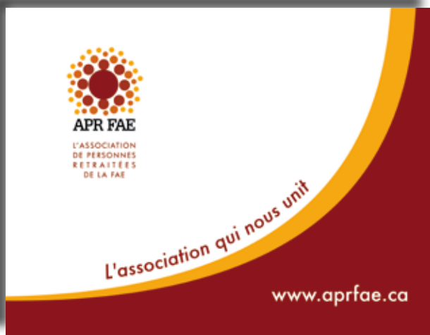
Signature graphique de l'APRFAE