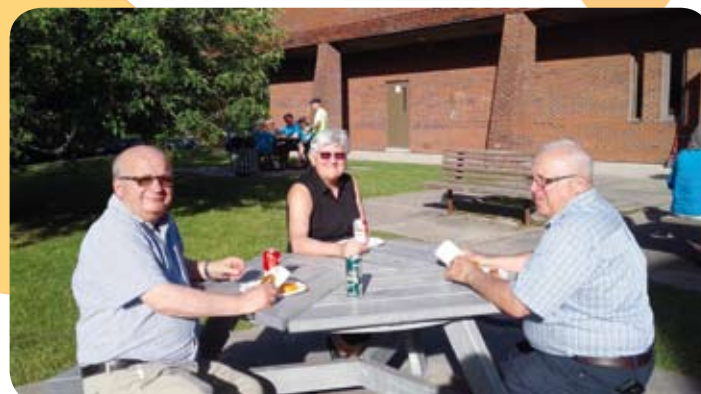
Le comité exécutif de l'APRFAE s'est joint aux membres de l'Outaouais pour leur BBQ annuel