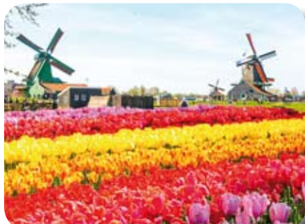
Le parc de Keukenhof

Pâques, les fleurs brillent de leurs mille feux et 3 événements nous ont attirés : les Serres royales de Laeken, à Bruxelles, ouvrent leurs portes 2 semaines par année au grand public, et l'argent prélevé va à des œuvres caritatives de Belgique ; aux Pays-Bas, le Corso fleuri se veut un défilé unique au monde de 20 chars allégoriques en fleurs ; et en fin, toujours aux Pays-Bas, le Keukenhof qui sera dans sa haute saison de floraison. Vous verrez des champs à perte de vue de tulipes, de jacinthes et d'autres fleurs aux couleurs vives.