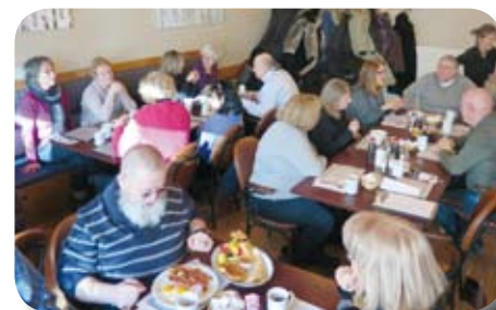
Déjeuner au Coco Gallo en 2015